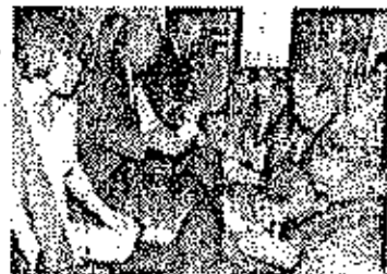
Firma de los libros de colección del primer día de emisión a los asistentes al acto.

agradeció a los asistentes su invitación a un acto que representa para Latinoamérica y el Caribe la plena vigencia de un tratado para una zona libre de armas nucleares, y que pasadas tres décadas de su firma representa una negociación que no se detiene. Señaló que el poner fin a la carrera armamentista "es una meta a punto de lograr, o de hecho, se ha logrado". El Tratado de Tlatelolco, según sus palabras, es pionero del desarme para hacer de éste un mundo mejor y más seguro y que auspicia la creación de otras zonas libres de armas nucleares. Finalizó diciéndole "nuestros votos desde esta tierra de gracia, paz y el desarme abran el camino de la paz social para todos los países de América".